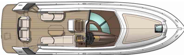
Версия: Кормовой камбуз