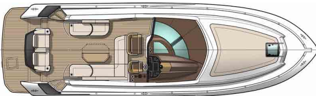
Версия: Кухня в кокпите